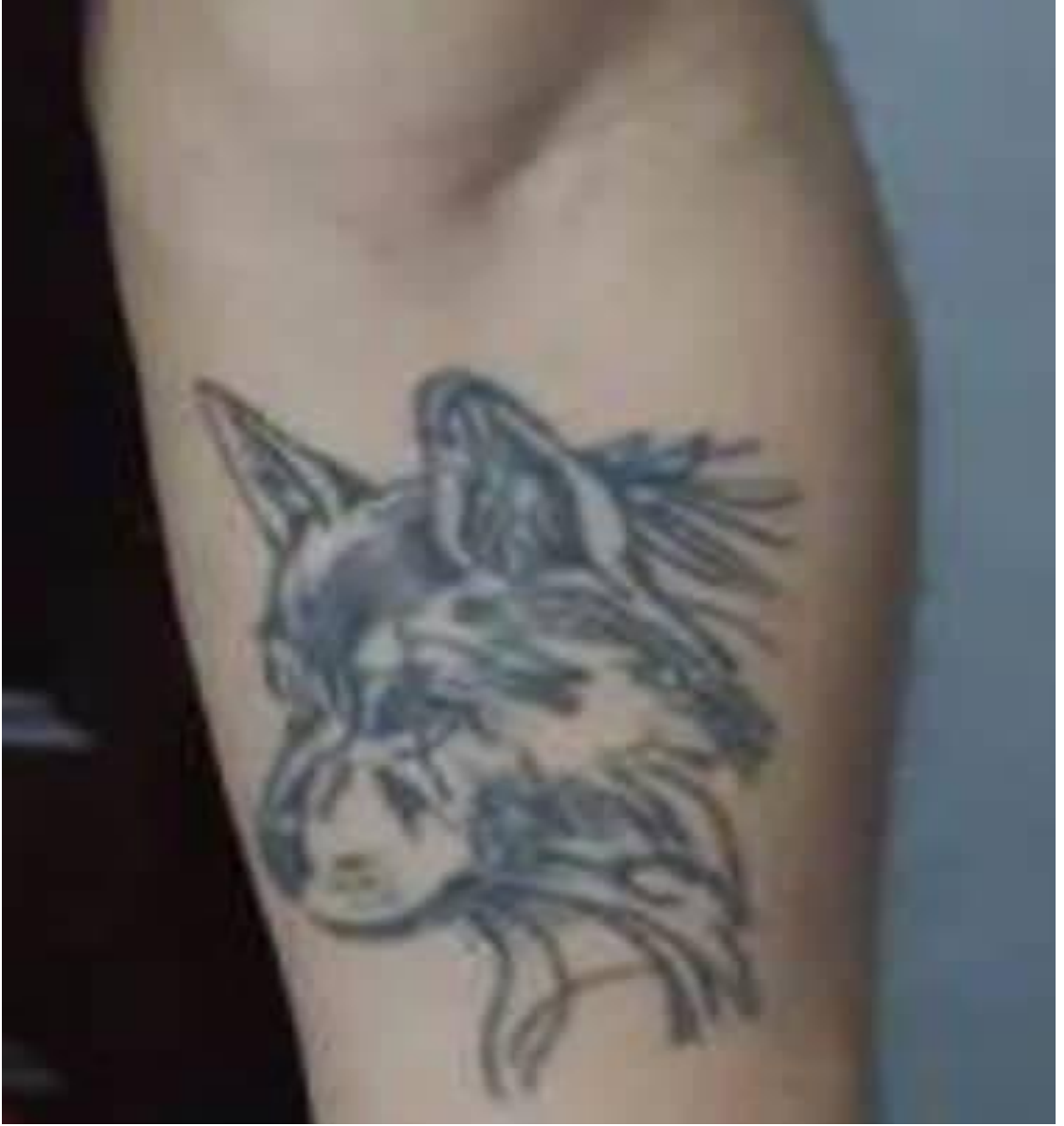
صورة رقم (4) من ميدان الدراسة عنوانها " كن ذئب ولا تكن خروف "