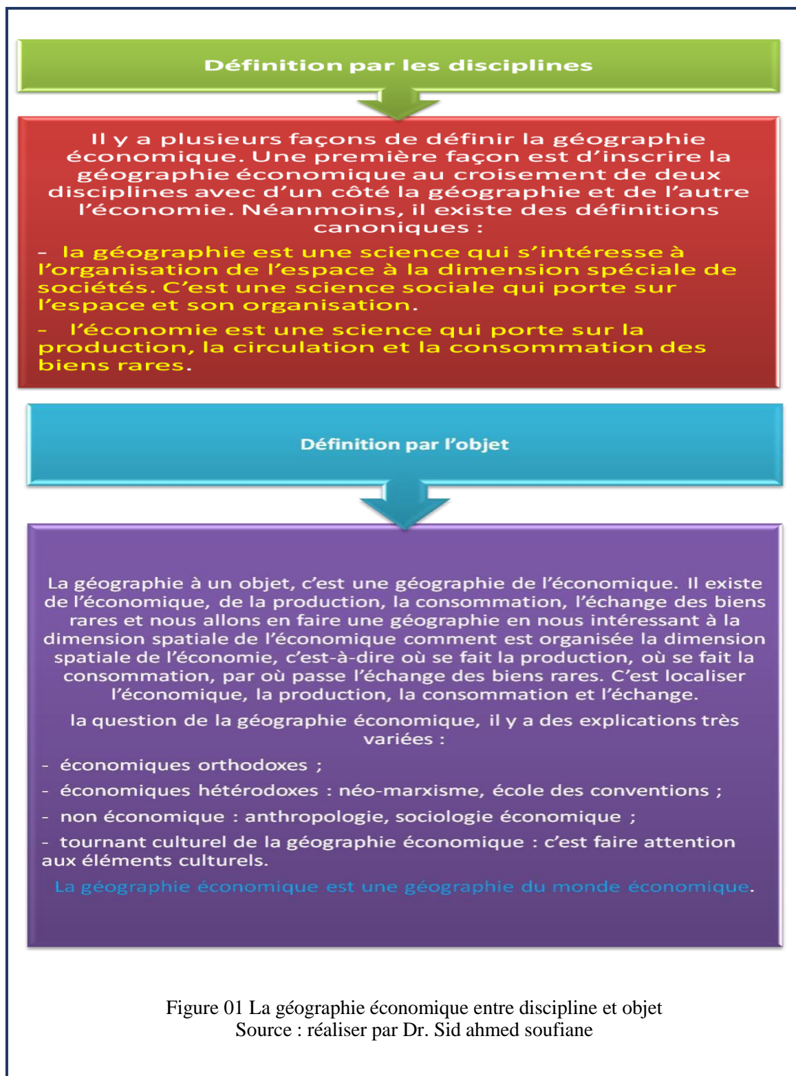
Figure 01 La géographie économique entre discipline et objet

La géographie économique joue un rôle essentiel dans la compréhension des défis économiques contemporains tels que l'aménagement du territoire, le développement durable, la compétitivité régionale, l'impact des changements climatiques sur l'économie, et la planification des infrastructures. Les connaissances issues de cette discipline aident les décideurs politiques, les économistes, les entreprises et les organisations internationales à élaborer des politiques et des stratégies économiques plus efficaces et adaptées aux réalités géographiques.