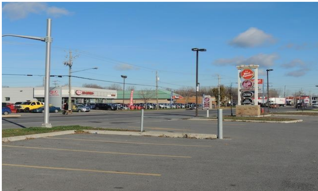
Figure 04 Exemple typique d'éparpillement des activités le long d'un axe routier