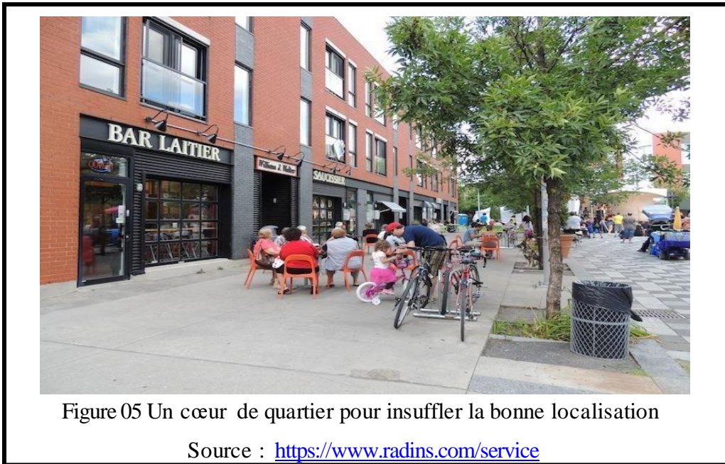
Figure 05 Un cœur de quartier pour insuffler la bonne localisation

Une localisation stratégique est nécessairement une solution gagnant-gagnant pour la collectivité, pour l'activité et pour les citoyens. Une collectivité qui encadre les choix de localisation le fait selon les principes suivants :